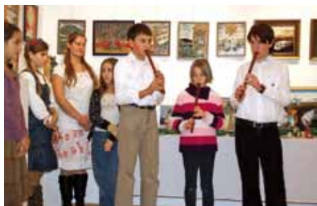
Ward Mária Művészeti Általános Iskola tanulói a pályázat értékelésén

Intelmek: „Szent István hagyatéka kereszténység, magyarság Európa közepén” című országos alkotó pályázatból készült tizenkét oldalas kötetet adventi ajándékként ingyenesen letölthetővé tettük a http://faluhaza.fw.hu oldalon. A nyomdakész kiadványt bárki kinyomtathatja honlapunkról. Ezúton szeretnénk köszönetet mondani a Német Nemzetiségi Önkormányzatnak és a Piliscsabai Németek Kulturális Egyesületének az egész évben nyújtott segítségükért és az ajándékkönyvekért, amelyeket az országos pályázatunkhoz adományoztak. Művelődési Információs Központ és Könyvtár